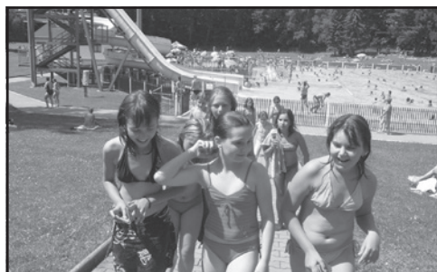
Koupaliště ve Skutči – oblíbený cíl celodenních výletů