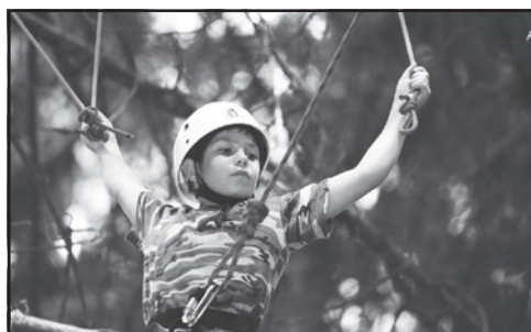
Lanové centrum v korunách stromů