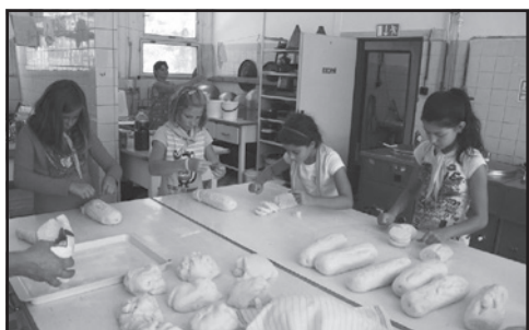
Čerstvé chutné jídlo připravujeme pětkrát denně