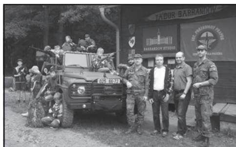
Copak je to za vojáka? No přeci kamarádi ze 102. průzkumného praporu z Prostějova